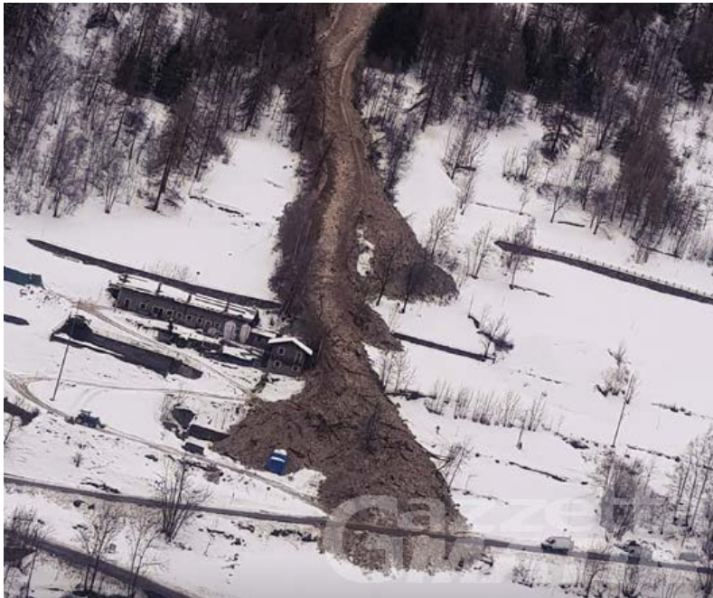
Figura 3 Evento del 22/01/2018