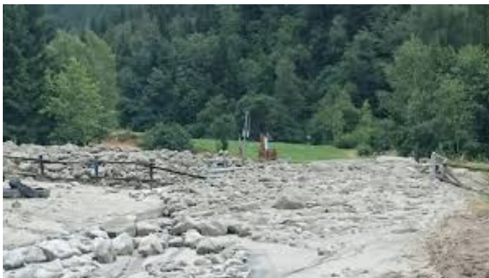
Figura 4 Evento del 2016